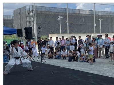
はるひ野武道空手