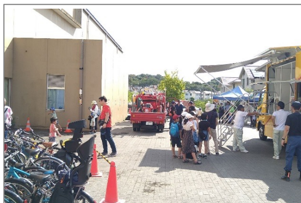
麻生警察署・麻生消防署