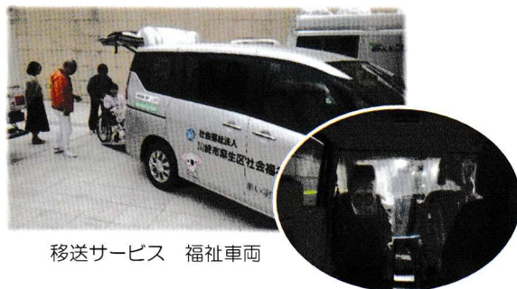
移送サービス 福祉車両

配布方法を変更し、区内の皆様へポスティングを利用して11月に広報紙「ほほえみ」をお届けいたしました。