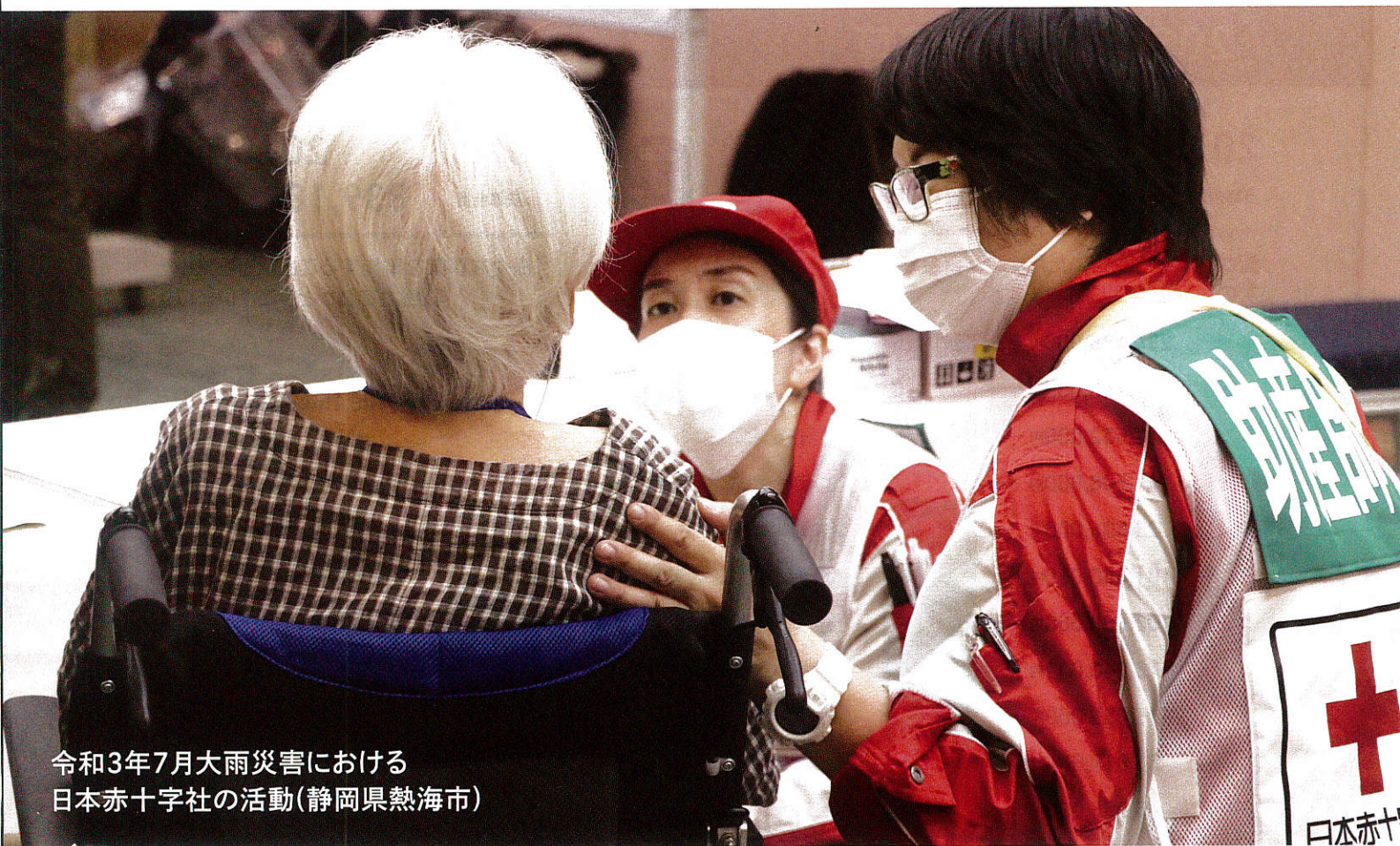
令和3年7月大雨災害における 日本赤十字社の活動(静岡県熱海市)