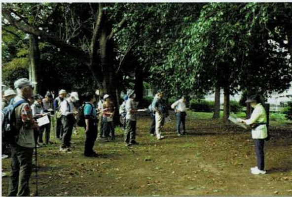
汁守神社での説明の様子