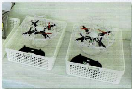
ドローンサッカー®の機体

今後も各種スポーツイベントにて体験会を開催する予定です。まだまだ知名度が低い競技ではありますが、ハンデや老若男女問わずに皆で楽しめるスポーツですので、是非ご参加下さい。〈笠原〉