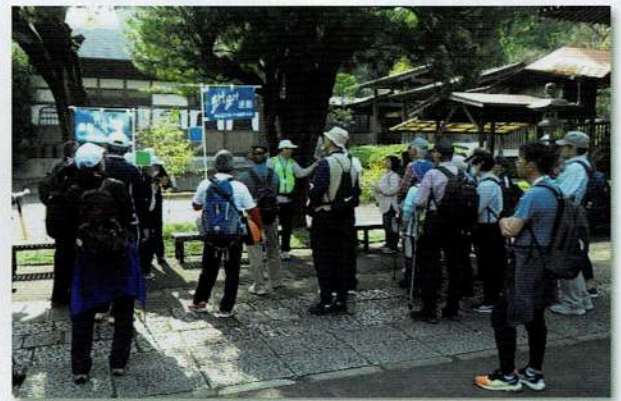
修廣寺での説明の様子