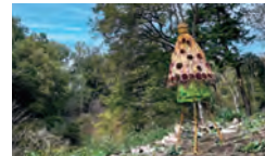
立川 真理子 「はじまりのはじまり」