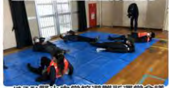
はるひ野小中学校避難所運営会議