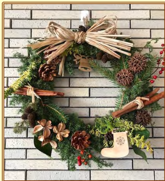
イメージ写真 リース直径25cm

今年もクリスマスリース作り ワークショップを開催します！ よこやまの道で拾ったどんぐりや 松ぼっくり、花壇で育てた綿花や 千日紅など、身近なものでクリス マスリースを製作します。