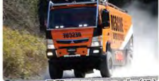
三菱ふそうトラック・バス(株)