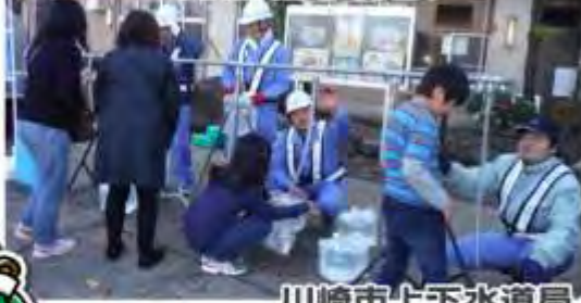
川崎市上下水道局