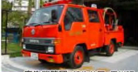
麻生消防団 柿生分団 黒川班