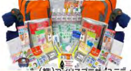
(株)アイリスプラザ ユニティ